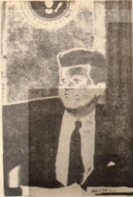
Başkan Kennedy imtihanda...

Birleşik Amerika, Amerikan Haberler Ajansı vasıtasıyla Sovyet ihtarına karşı yayımlanan cevabında, Amerika'nın bu ihtardan yılmayacağı ve gerekli tedbirleri alacağını bildirmiştir. Böylelikle iki taraf da tutumlarını belirtmiş bulunuyorlar. Fakat açıkça bilinen yön, Sovyetlerin Küba'ya destekleyecekleri, Amerikanın ise kıyılarından 150 kilo metre ötede bir Castro Kübasının varlığından hoşlanmadığıdır. Yoksa bunun ötesinde Küba meselesinin nasıl bir çözüme varacağı bilinmemektedir.