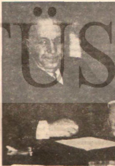
İsmail Beyazıt «Adada, Modada...»

Erim — Gülek — Güle grubu da boş durmuyor ve Kurultaya hazırlanıyor. Bu grubun tabii lideri Nihat Erim. Erim, sabırlı ve uzun vâdeli bir politika yürütüyor. Erim'e göre, İnönü mevcut oldukça C.H.P. içinde önemli değişiklikler yapılamaz. Bu sebeple, ihtiyatsız ve sert çıkışlar fayda getirmez. İnönü'ye karşıya alınmaktan mutlaka kaçınmak lâ-