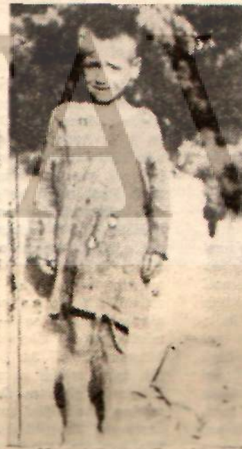
Madenlerde ücretsiz bir işçi

Aşağıya indik. İkel barınakları gezdik. İçerde pala — pürü içinde küçük çocuklar gördük. Yandık sineklere yem olmakta olan çocuklara. Birkaç tane de kışla tarzında yapılmış binalar var. İki katlı ranza biçimindeki