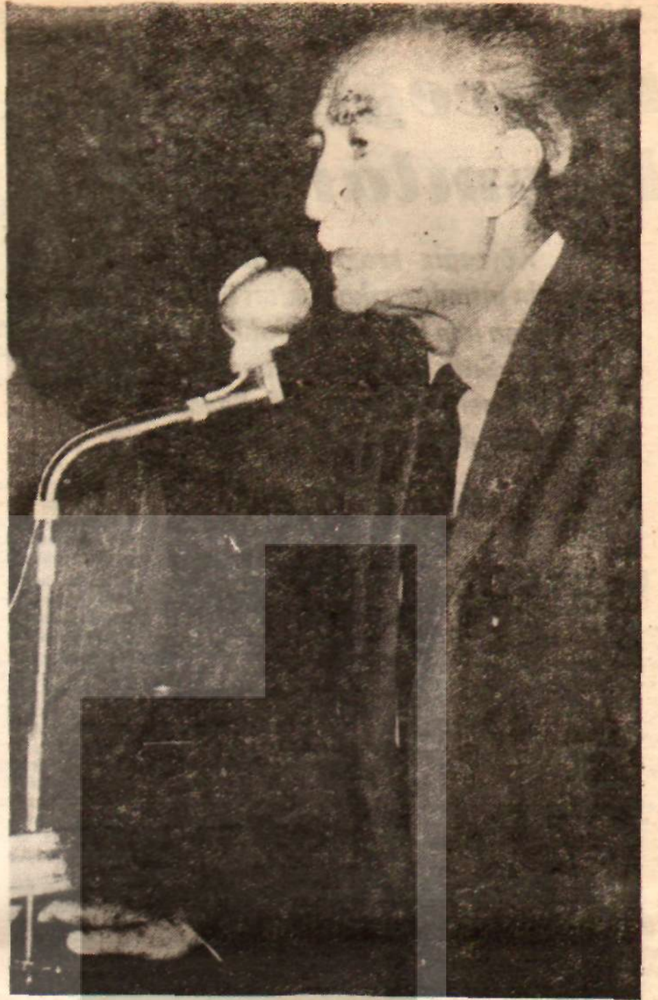
Avni Doğan Ne istiyor?