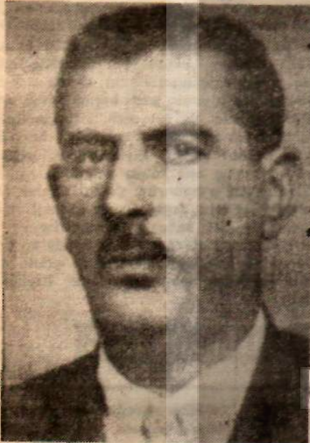
Sohumz Asfan «Parti Atatürkü unuttu»

İşte diyorlardı, nihayet İnönü de doğru yolu gördü. Tutulan yolun yol olmadığını anladı. Fakat bu sevinç uzun sürmedi. Alkışlar bir süre devam ettikten sonra dindi. Ümidin yerini hayal kırıklığı aldı. Zira Genel Başkanın geri kalan cümlelerinden, C.H.P. için aranması gereken yeni şekil ve yönün, koalision kanallarının iyi geçinmesini sağlayacak tedbirlerin bulunmasından ibaret olduğu anlaşıldı. Pek çok insan, demek ki diye düşündü, bir haftadır yapılan bunca konuşma, ortaya dökülen bunca şikâyet, bunca dert hep boşunaydı. İnönü, «Aman, koalisionu ayakta tutalım» demekten öteye gidemiyordu. Koalision methiyeleri ise, huzursuz CHP grubunu yatıştırmaktan çok uzaktı. Bununla beraber Başbakan İnönü,