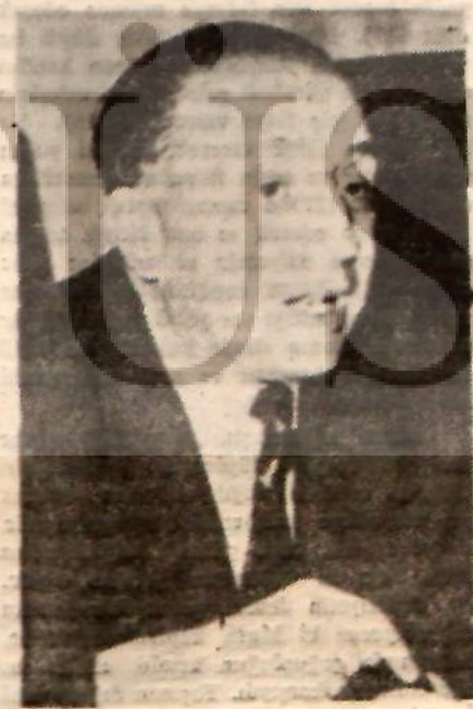
Beşir el Azim iki yanı arasında

Bir kaç gün önce, «Özel» sermaye özel çıkar ve gerici işbirliğinin doğurduğu sessiz hükümet darbesi sonucunda uzaklaştırılan Beşir El Azem hükümeti ise toprak reformu ve şirketlerin devletleştirilmesi gibi geniş halk yığınlarını mem-