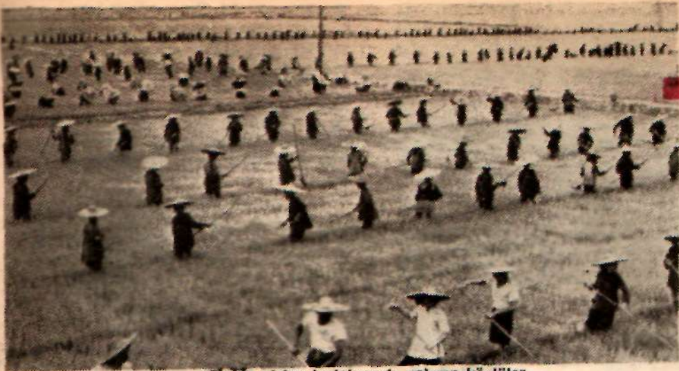
Çin'de piring tarlalarında çalşan köylüler

gerçeğe girebildiği meselesi ortada kalıyor. Denemeler bize göstermiştir ki, bu ülkelerin bu gerçeğe girişleri kolay değildir. Ulaşma yolları Tunus, Fas, Senegal, Filistin Kıyası v.s. ülkelerde, Cezayir veya Gine'deki olduğundan çok çabuk bulunmuş; bunun sebebi, birincilerde Fransız menfaatleri ile halkın bağımsız özlemi arasında arabuluculuğu sağlayan yerli bir idareci sınıfın varlığı, ikincilerde ise böyle bir sınıfı yokluğudur.