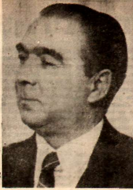
Fakih Özlen «Önce ahîk, sonra parti»

CHP mensuplarına itidal tavsiye eden Başbakan, bilhassa Meclis müzakereleri sırasında CHP ilerin YTP ilere ve CKMP ilere karşı asla tahrikkar davranmalarını ve hele bu partiler mensuplarını eski DP'nin varisleri olarak göstermemelerini istedi. «Alican ve Dinçer partilerine mensup milletvekillerine kendi partilerinin DP'nin varis partiler olmadıklarını, yeni birer parti olduklarını anlatmaya onları o yola sevk etmeye çalışıyorlar. Biz de bu konuda ortaklığımıza yardımcı olmalıyız, lüzumsuz tahriklerde bulunmamalıyız. Ortaklarımızın içinde intikamcı ve kinacı yoktur» dedi.