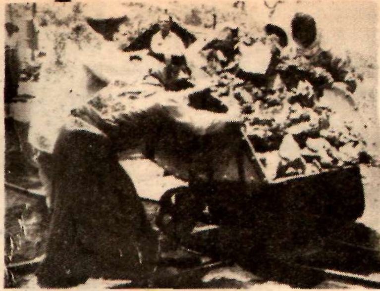
Dekavillere maden dolduran kadın işçiler