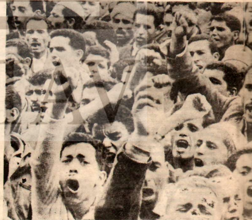
Millî Kurtuluş hareketini başarı ile tamamlayan ve şimdi siyasi ve iktisadi bağımsızlığa

İkinci Dünya Savaşını izleyen «sömürgecilikten çıkış» devresi, yüz milyonlarca insanı bağımsızlık macerası içine attı. Bu ülkeler o korkunç geri kalmışlıklarını ortadan kaldırmayı nasıl ümit edebilirler? Kapitalizmin bu soruya verdiği cevap pek de cesaret verici değildir. Birleşik Amerika'nın ve belli başlı batılı ülkelerin yaptıkları iktisadi yardımların, bağımsızlığa yeni kavuşmuş genç ülkelere ya iktisadi bir durgunluk için dedirler ya da —meselâ Hindistan'da olduğu gibi— oldukça ağır bir ilerleme kaydetmişlerdir. Endüstri bakımından ilerlemiş ülkelerle (buna Sovyetler Birliği ile halk demokrasileri de dahildir), az gelişmiş ülkeler arasındaki uçurum azalmak şöyle düşün gittikçe büyümektedir. Yarı feodal tarım yapısının devamı, ticarî sermayenin anormal artışı, kredinin bir kısmında halâ göze çarpan tefeci özellikli, teknik kadrolardaki eksiklik ve nihayet soistimaller müs tahsil kuvvetlerin çabucak gelişmesini önleyen engellerdir. Sanayi burjuvazisi, var olduğu yerlerde, şüphesiz bu engellerden bazılarını ortadan kaldırmak ister, fakat burjuvazinin davranışı çekingen ve yetersizdir. Burjuvazi aynı zamanda daima, ihtilâl dalgasının korku veren sürekli görünüşü karşısında bütün imtiyazlı sınıflarla dayanışma kurmak zorunluluğuyla karşılaşır. Üstelik bu ihtilâl dalgası öyle güçlüdür ki, bunun yarat