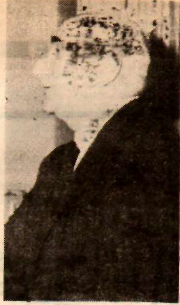
Cumhurbaşkanı Gürsel «Ben ihtilalle geldim»

Şimdi de 27 Mayıs ve 27 Ma yısçılara amansızca hücum edili yor. Edilmektedir. Bunların karşı lıkız kalmıyacağı biliniyor.