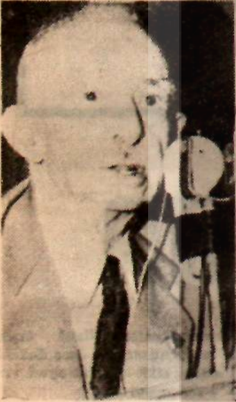
İsmet İnönü «Tahrikler karşılıksız kalmıyacak»

27 Mayıs aleyhtarlığının şam piyonluğunu yapan politikacılar, bu ihtilalin mânasını acaba anlaya bilecekler mi?