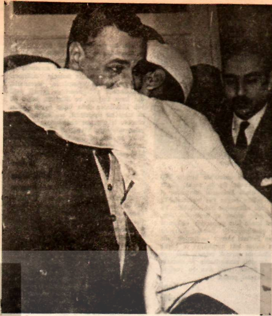
Başkan Nâsir, bir fellahtan sevgiyle kucaklanıyor

Endüstrileşmiş ülkelerin halkından, gelirlerinin bir kısmını az gelişmiş bölgelerin yardımına koymak için ayırmaları istenebilir mi? Bu da, hemen hemen birinci faraziye kadar hayalidir; zira gözlerinin önünde üçüncü teknik ihtilalin bütün mucizelerinin çoğaldığını gören bu milletler gelecekte hayal seviyelerinde bir azalış değil bir artış bekliyorlar.