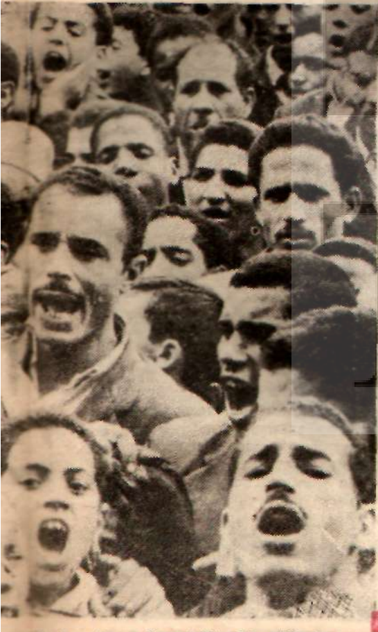
nasılla hazırlanan Cezayirli bir mitingte

İktisadi alandaki eşitsizlikleri ortadan kaldırmak için hukuki alanda eşitliği sağlamak yetmez. Sovyetler Birliği ile Yunan lavya arasındaki çatışma, bize, sosyalist partili iki ülke arasında doğabilecek rekabeti göstermiştir. Bu zıtlıkların, sosyalist bir Avrupa ile sosyalist bir Afrika arasında da